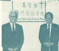
于牧師與吉院長合影 ►