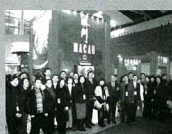
廣州國際旅遊展銷會