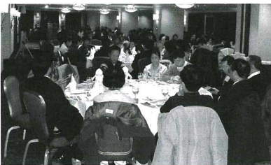
「第七屆華人福音會議」將於2006年7月17-21日在澳門舉行，大會於本月13日晚召開籌備工作預備大會，本澳共有約160名教牧同工和信徒出席聚會(下圖)。

3月27日復活節，是最古老最有意義的基督教節日之一。楊牧谷博士會說假如基督只有受難而沒有復活，那麼