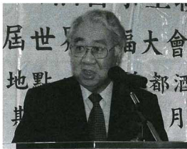
「第七屆華人福音會議」將於2006年7月17-21日在澳門舉行，大會於本月13日晚召開籌備工作預備大會，本澳共有約160名教牧同工和信徒出席聚會(下圖)。

今屆華福大會主題為「基督全人福音遍萬邦一慶祝福音來華二百年」，總幹事高雲漢牧師(上圖)在預備會上解釋「華福」是普世華人教會的差傳運動，而推動華福的異象是「華人教會，天下一心，廣傳福音，直到主臨。」藉此鼓勵華人教會繼續發揚福音對社會的影響力，接重要的一棒，遍傳福音。高牧師接著又解釋華福運動的作用： 1. 從「一盤散沙」到「相愛合作」：在全球57個地區成立「華福區委會」。 2. 從「祖傳秘方」到「公開分享」：舉行國際性會議，在五年一次的「華福大會」中分享經驗及異象。 3. 從「各自為政」到「普世差傳」：打破「各自掃門前雪」的觀念，緊密合作，使基督福音遍傳天下。