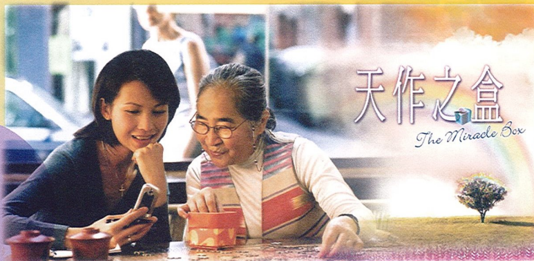
2004年蔡少芬主演《天作之盒》，以沙士作題材，香港影音使團製作。

媽咪見我忙得不眠不休，竟然還往教堂跑，便怒不可遏，說我給什麼迷住了，不准我去教會。有一次，甚至跑到教會大吵大罵，這事之後，我停止聚會近一個月。在這期間，不斷禱告求上帝軟化媽咪的心，又求媽咪准我去教會，之後媽咪才准我相信耶穌。後來她因為我的緣故，雖然不信，也把拜了多年的偶像全部丟棄。我的哥哥認識了一些弟兄姊妹，跟著也信了耶穌。自此，兄妹二人常分享，互訴心事，更一起為家庭禱告，非常甜蜜。信主一年後，很羨慕接受浸禮